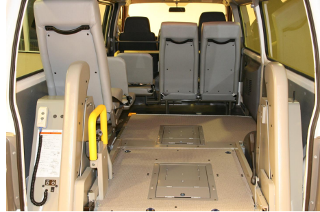
車いす2脚又はストレッチャー搭載可能