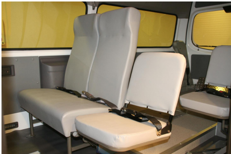
専用ビニールレザーシート