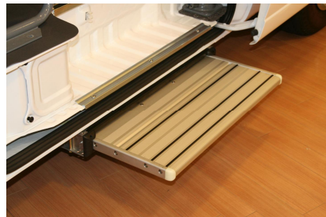
幅700mm×奥行300mmの電動大型ステップ